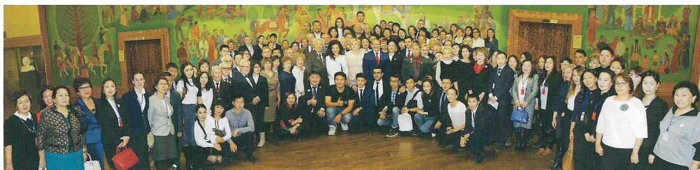
С делегатами II Съезда юристов Якутии (07.10.2016 г.)