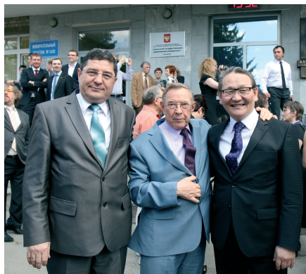
С Патриархом российского права, советником Президента России В.Ф. Яковлевым