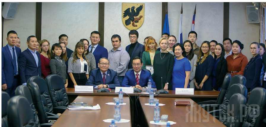
Подписание Соглашения о сотрудничестве между Городским округом «город Якутск» и ЯРО Ассоциации юристов России (19 декабря 2017 г.)