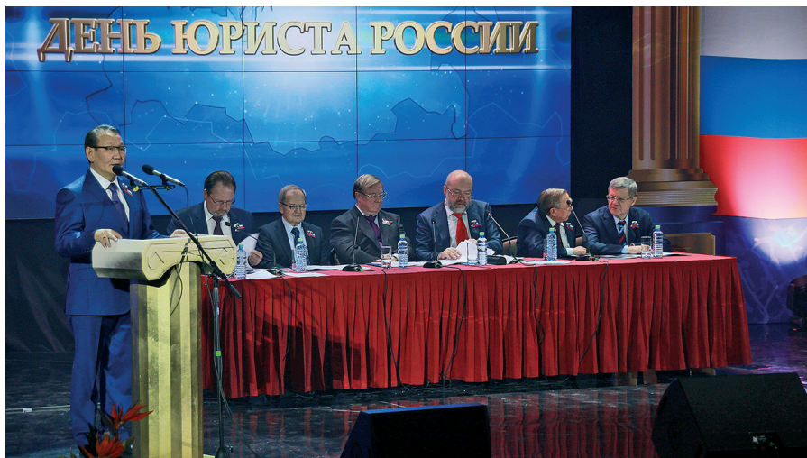
На V Съезде Ассоциации юристов России (3 декабря 2014 г.)