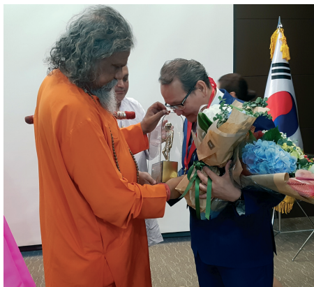
Лауреат Международной премии мира им. Махатма Ганди (2016 г.)