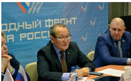
На заседании ЯРО «Народный фронт «За Россию!»