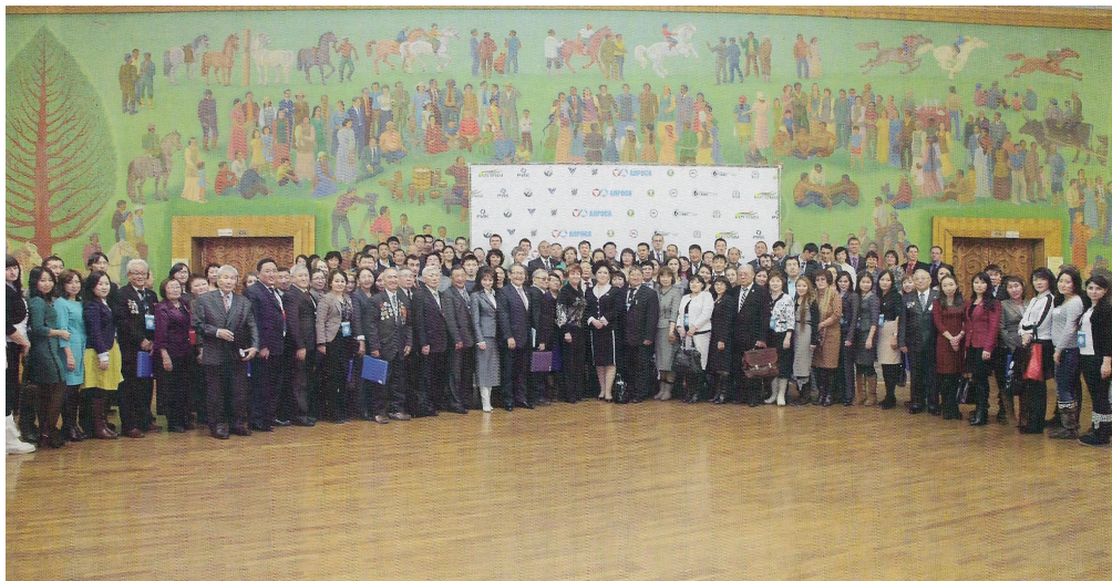
С делегатами I Съезда юристов Якутии (03.12.2013 г.)