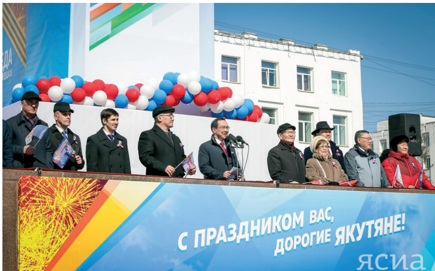
Первомай в Якутске (2019 г.)