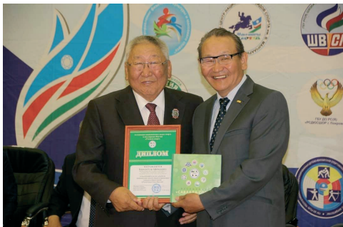
С Главой Якутии Е.А. Борисовым