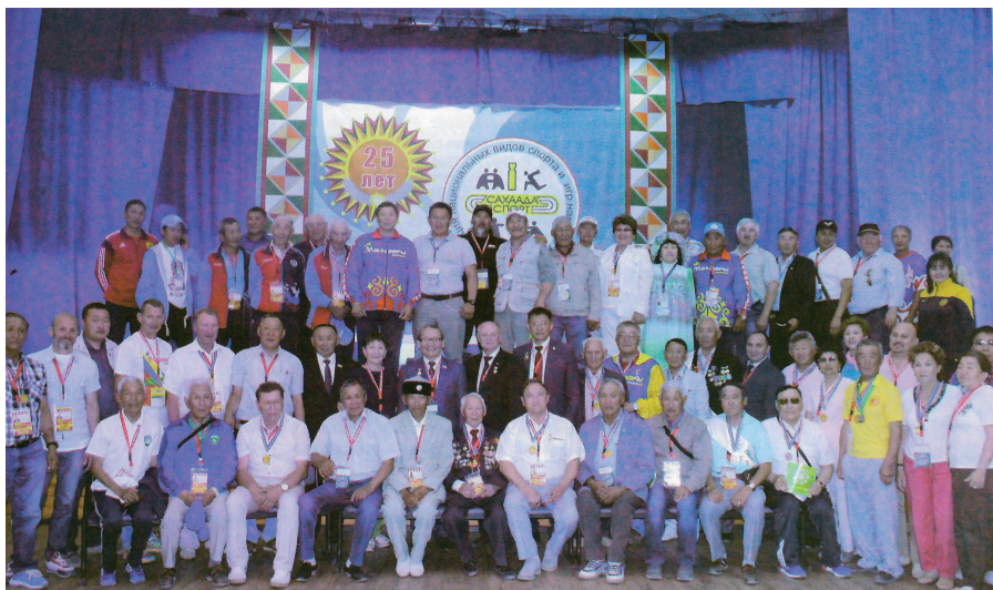
Ассоциации «Сахаада-спорт» 25 лет! (Июль 2017 г.)