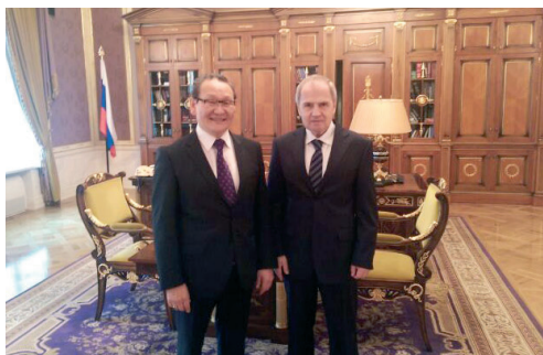
С Председателем Конституционного Суда РФ В.Д. Зорькиным