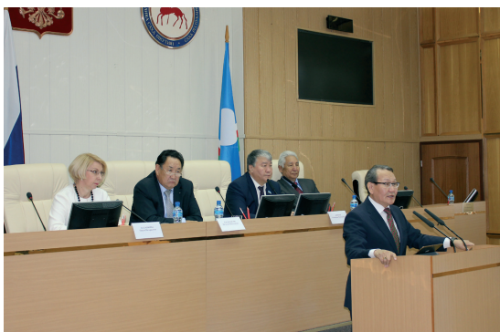
На трибуне Парламента Якутии