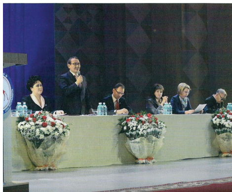
Ведение I Съезда юристов Якутии (03.12.2013 г.)