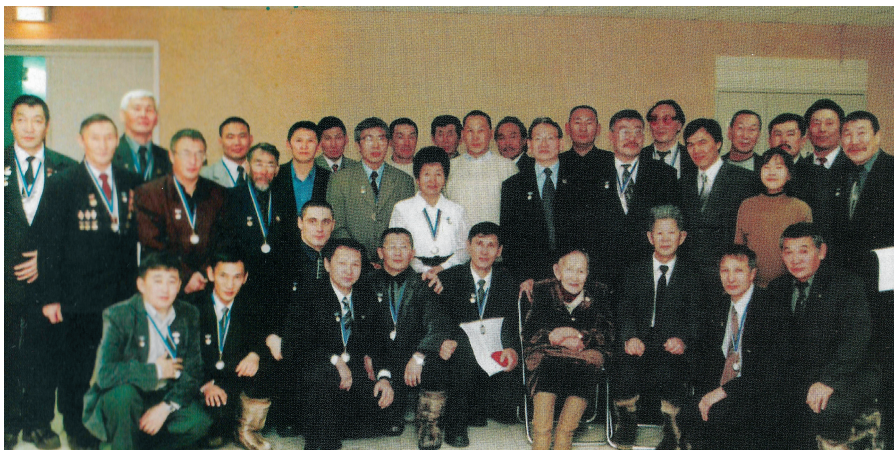
С лауреатами Ассоциации Сахаада-спорт XX века