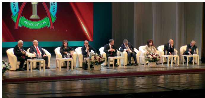
Ведение III Съезда юристов Якутии (19.12.2019 г.)