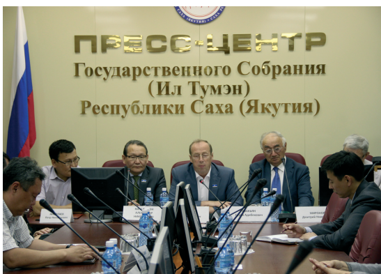
Заседание Научно- Консультативного Совета при Конституционном суде Якутии