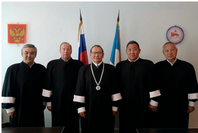
Состав Конституционного суда Республики Саха (Якутия)