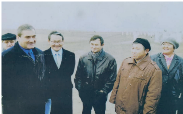
С Президентом Якутии В.А. Штыровым в Хангаласском улусе