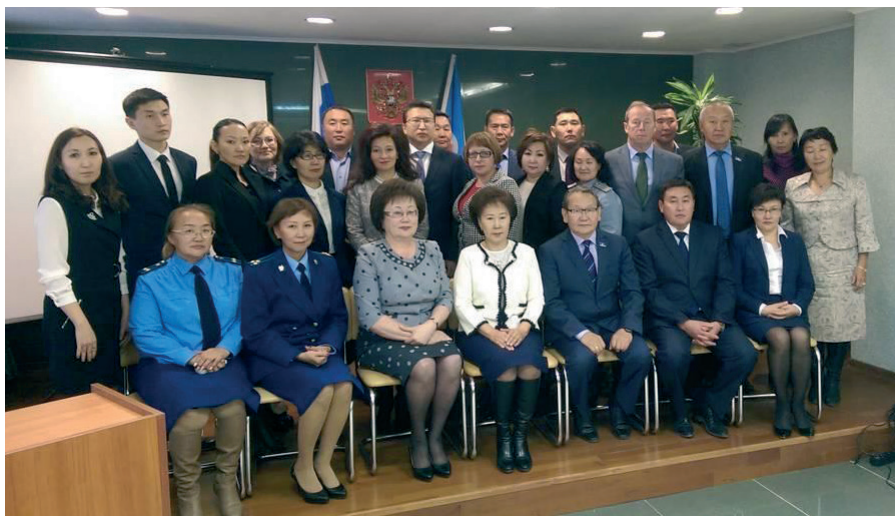
Судейское сообщество Якутии