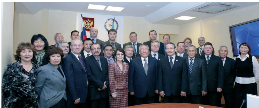
С профактивом Якутии