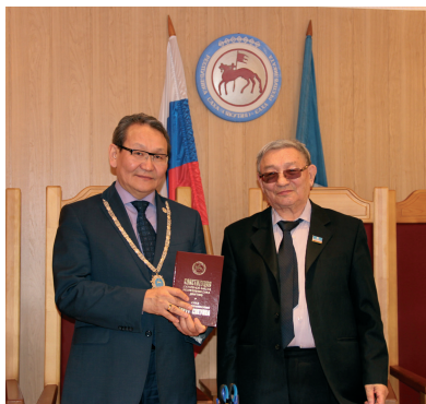
С Первым Председателем Конституционного суда Республики Саха (Якутия) Д.Н. Мироновым