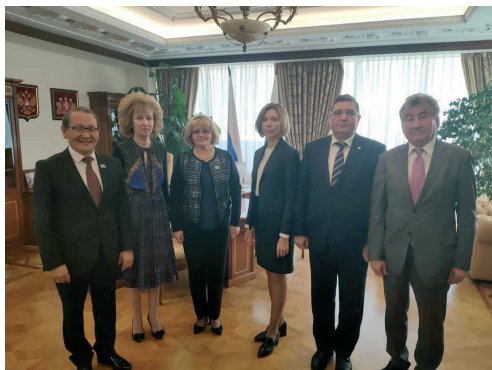
С коллегами-Председателями Конституционных и уставных судов субъектов РФ