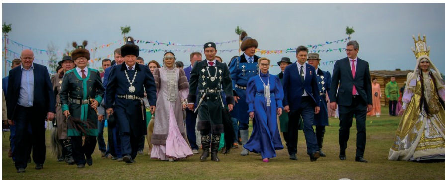
На национальном празднике Ысыах