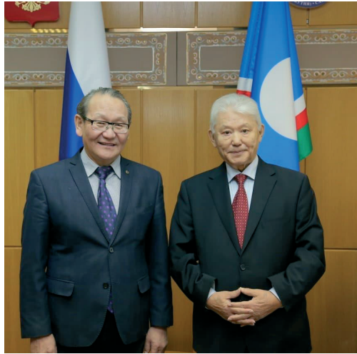
С Первым Президентом Якутии М.Е. Николаевым