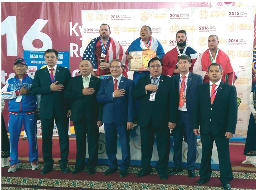
Руководство Международной Федерации мас-рестлинга на Чемпионате мира – 2016 г.