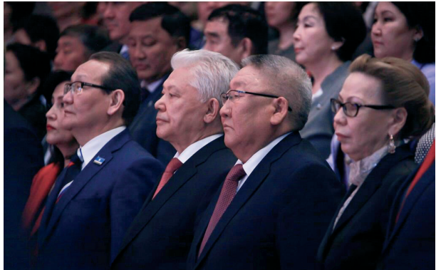
С двумя Президентами Якутии М.Е. Николаевым и Е.А. Борисовым