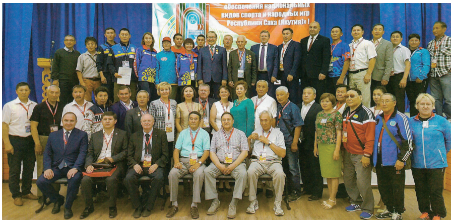
На научно-практической конференции обсуждены вопросы развития национальных видов спорта