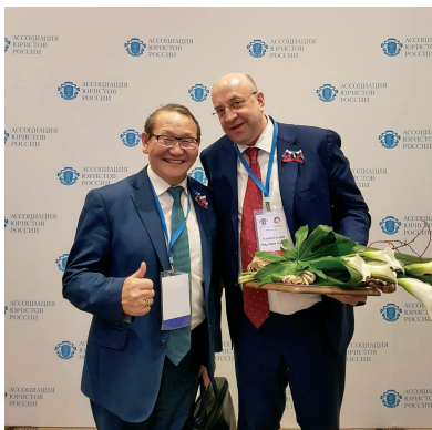
С Председателем Ассоциации юристов России В.Н. Плигиным