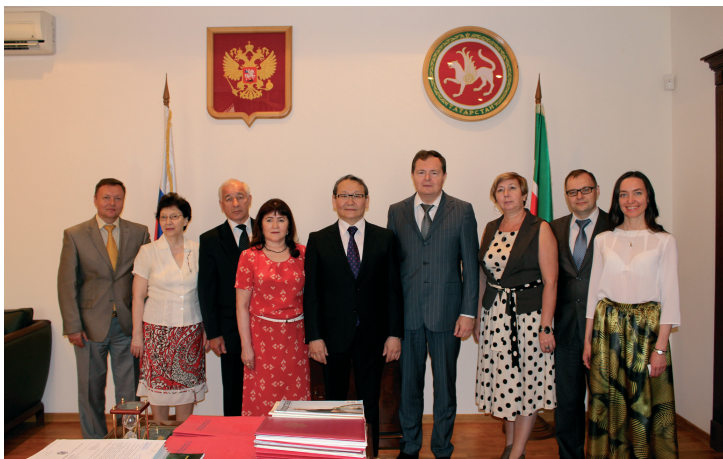
С татарстанскими коллегами