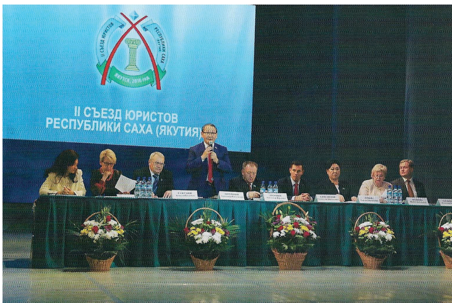
Ведение II Съезда юристов Якутии (06.10.2016 г.)