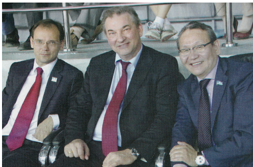
С легендарным Владиславом Третьяком