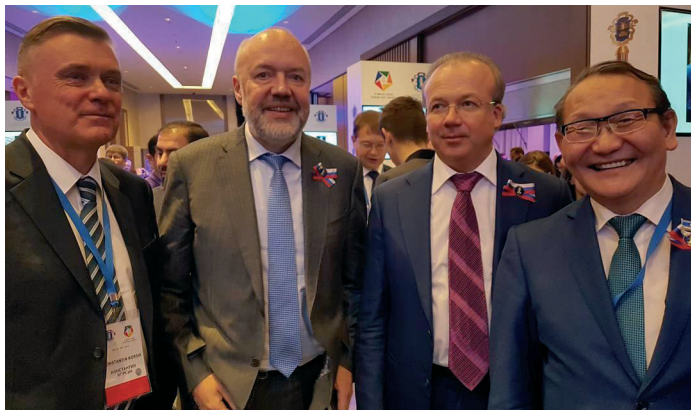
На Съезде юристов России