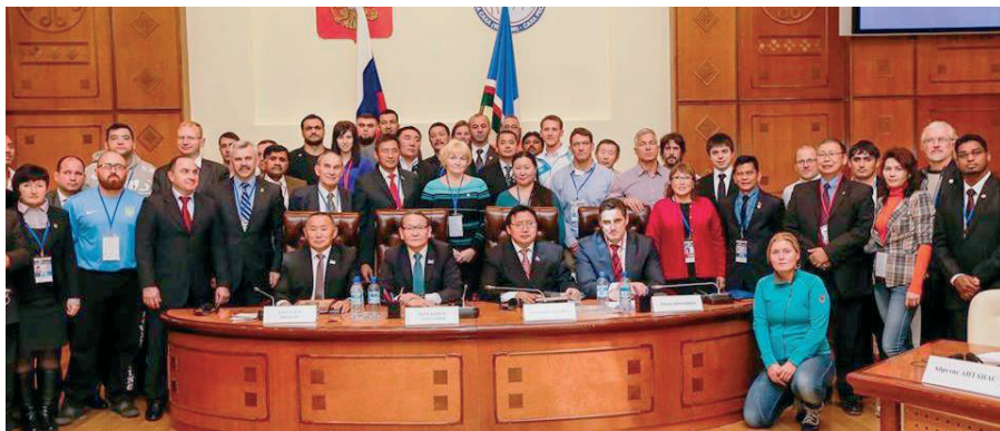
Заседание Конгресса Международной Федерации мас-рестлинга (2014 г.)